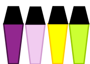
4 surligneurs (4 couleurs différentes)