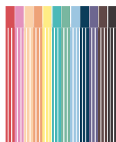
12 feutres (de couleur)