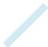
règle (rigide de 30 cm)