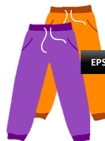
1 survêtement (haut et bas)