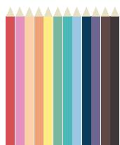
12 crayons (de couleur)