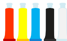
5 tubes de gouache (rouge, jaune, bleu, blanc, noir)