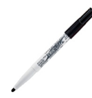
2 feutres effaçables (pour tableau blanc)