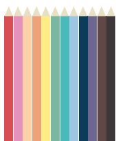
12 crayons (de couleur)